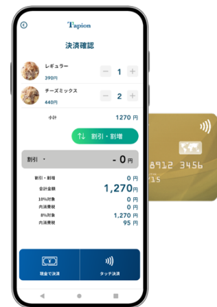
Tapion 決済画面イメージ

当社では今後の本格展開に向け、今回のパイロット運用を通じ機能改善を行なっていくと共に、「Tapion」でキャッシュレス決済、及びタッチ決済の普及拡大に努めて参ります。