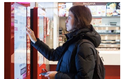
上：VP6800 イメージ、下：自動精算機利用イメージ