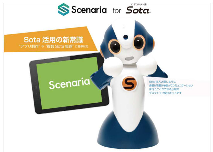
Scenaria for ロボコネク用 Sota

近年、多くの企業で受付・案内・接客等で様々なサービス用ロボットが導入されています。こうしたロボットを効果的に活用するために、例えば多店舗を有する小売業の場合では、イベントや新商品の入荷にあわせた商品紹介、キャンペーン時の特殊対応など、コンテンツのタイムリーな更新が求められています。当社ではこのような状況下で、社内外のシステム部門に頼らず、アプリ開発の経験が無いビジネスの主管部署でもコンテンツの更新ができるソリューションが重要と考え、Scenaria を開発しました。