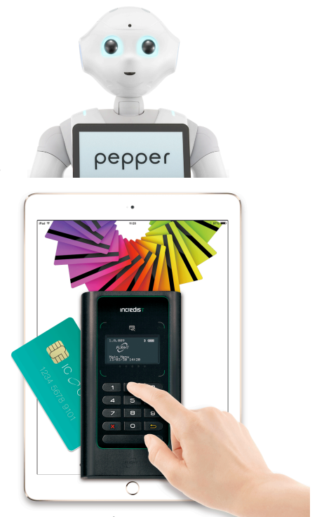
スマートデバイスを活用した 当社決済ソリューション

Pepperによるお客様ヒアリングを通じて、より専門性の高い情報をお望みのお客様、より購買意欲の高いお客様は専門員へ誘導することで、限られた人員の有効活用および効率的な購買までの導線を実現することが可能になり、売上機会の損失を防ぐことが可能になります。