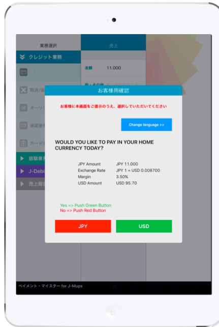
通貨選択画面イメージ