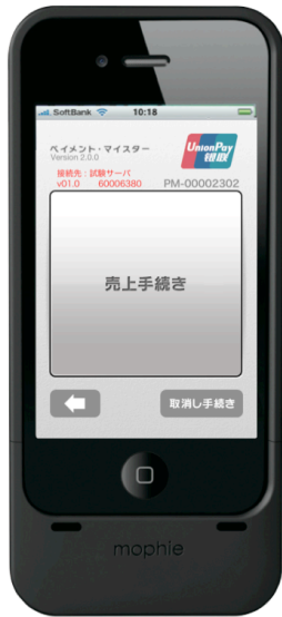
【トップ画面】 クレジットカード決済か 銀聯決済が選択