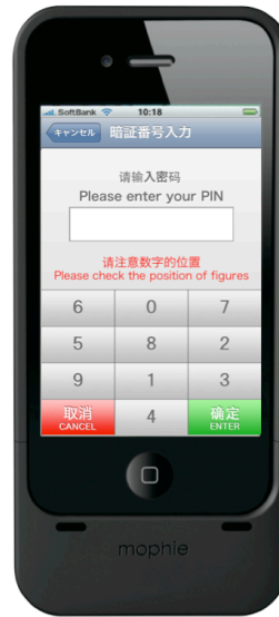
【暗証番号入力画面】 ソフトウェア PIN パッド対応