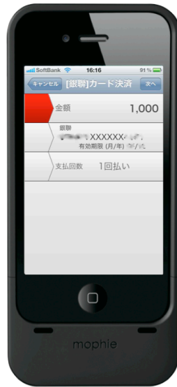
【決済情報確認画面】 カード情報は高セキュリティで 暗号化