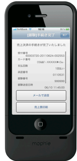
【完了画面】 レシートプリンタによる 印刷に対応