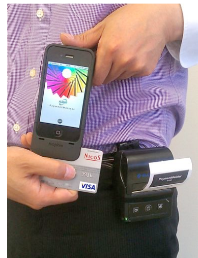
P25-i は専用の留め金を利用し腰に装着可能 両手が自由に使えるので決済も可能に！

当社ではペイメント・マイスターのモバイル印刷対応に関し、本製品を標準オプション品として 9 月より発売を開始します。またペイメント・マイスターだけではなく、iPod touch、iPhone、iPad を活用した各社の業務用アプリケーションと連携した様々な印刷用途向けにも、本製品の販売を積極的に行っていく予定です。