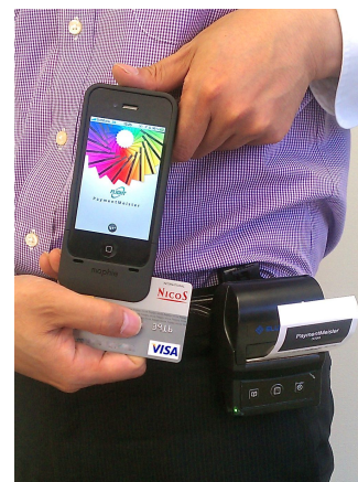
専用ケース、決済専用アプリ、Bluetooth モバイルプリンタ

専用決済端末以上の高付加価値機能の実現もさることながら、ペイメント・マイスターでは iOS 機器を採用することで、従来の決済専用端末とは一線を画した洗練されたデザインによる決済専用端末を実現しました。また国内のセキュリティガイドラインに準拠した安心・安全な決済により、スタイリッシュさだけではない信頼性のある決済ソリューションの提供を可能にしました。