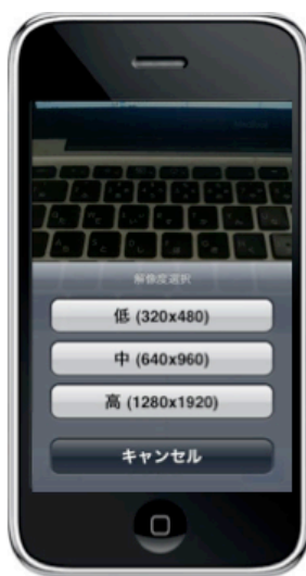
6. 写真の解像度選択機能