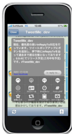
1-1. in reply toの会話表示機能