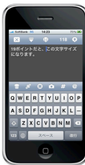
7. フォントサイズ変更設定機能