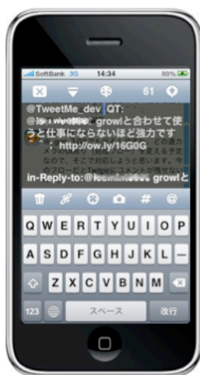
5. 引用付き返信機能