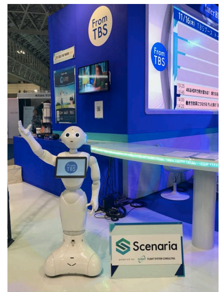
TBS ブースで案内をする Pepper

当社では、開催期間中の本日 11 月 16 日に、TBS ブース【ホール 7 /7305】にて Scenaria を使って制作・管理された Pepper による案内等を披露しています。会場では、Pepper が TBS ブースの展示物の案内の他、各種トークセッションの案内や呼び込みを行っております。案内にあたり、事前に Scenaria で作成したコンテンツをタイムスケジュール機能で設定した時間に流しています。